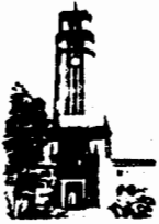
Recinto de Río Piedras

Señores Decanos, Directores de Escuela, de Unidades Académicas y Administrativas